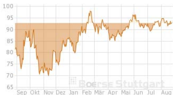
Graf: Vývoj ceny zlata za posledních 12 měsíců

Co se stane, pokud cena zlata za měsíc poklesne pod tuto realizační cenu opce? Kupující opce svého práva využije a my od něho budeme nuceni zlato nakoupit. V takovém případě však nepřistoupíme k okamžitému prodeji zlata na trhu a inkasování ztráty, nýbrž k dalšímu rolování, tentokrát short call opcí. Tím poskytujeme kupujícímu právo od nás zlato za dohodnutou cenu zpět odkoupit, za což opět obdržíme opční prémii ve stejné výši, tedy zhruba 2 až 3%. Kupující toto právo samozřejmě využije pouze v případě, že cena zlata na trhu opět vzroste, v opačném případě však máme stále ochranu proti dalším propadům ve formě vyinkasované prémie a v rolování pokračujeme až do doby, než se nám zlato podaří znovu prodat. Celý proces se potom opakuje do nekonečna.